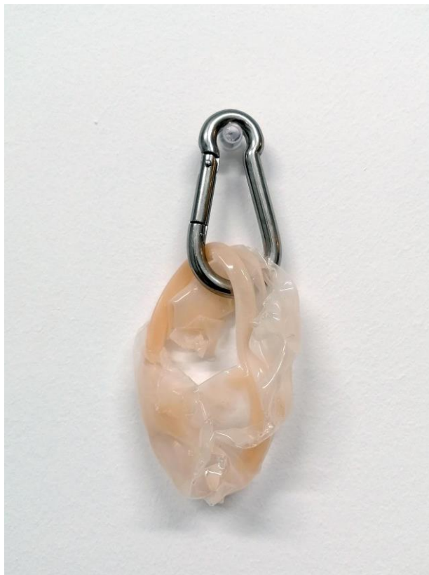
La piel construida. Javier Chozas.