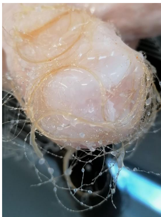
La piel construida. Javier Chozas.