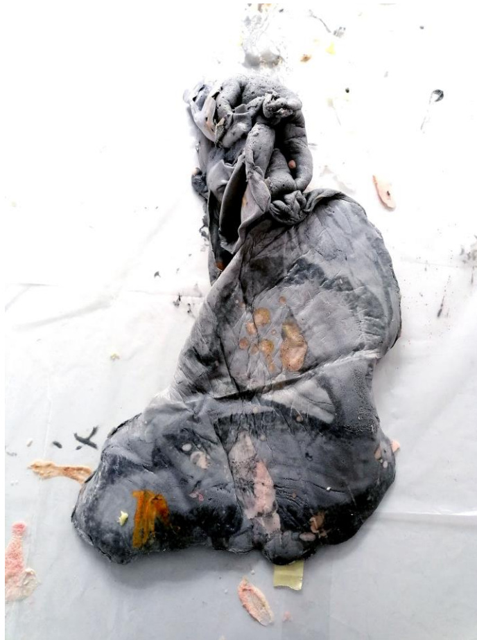
La piel construida. Javier Chozas.

Si deseas descargar imágenes en alta calidad pincha aquí