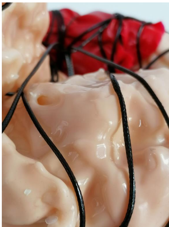
La piel construida. Javier Chozas. ©JavierChozas, 2020