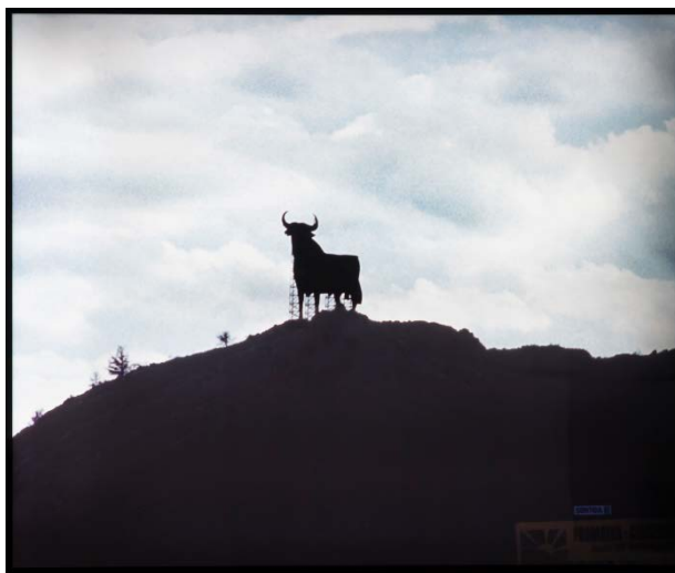
Serie Paisajes final del siglo xx 1993 © Joan Rabascall, ADAGP, París VEGAP, Madrid,