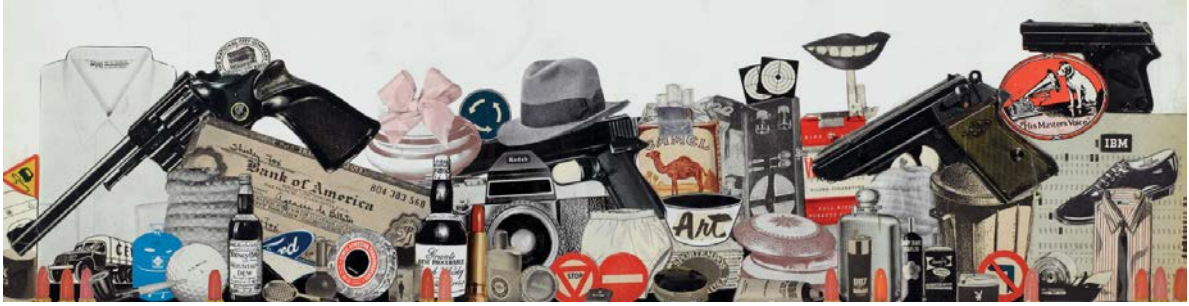
Al estilo americano de..., 1970 © Joan Rabascall, ADAGP, París - VEGAP, Madrid, 2020