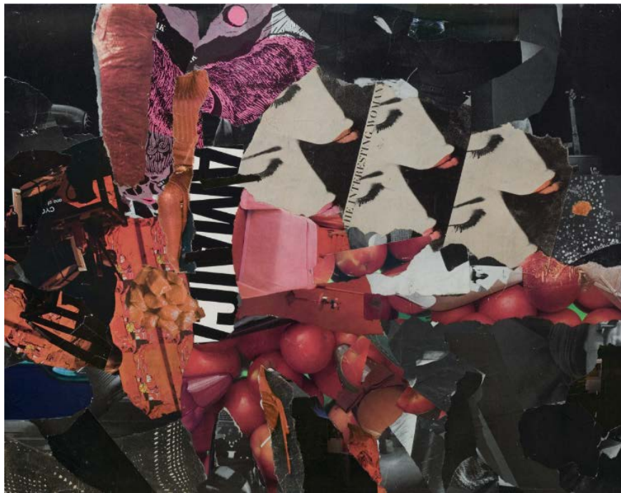
La mujer interesante, 1964 © Joan Rabascall, ADAGP, París - VEGAP, Madrid, 2020