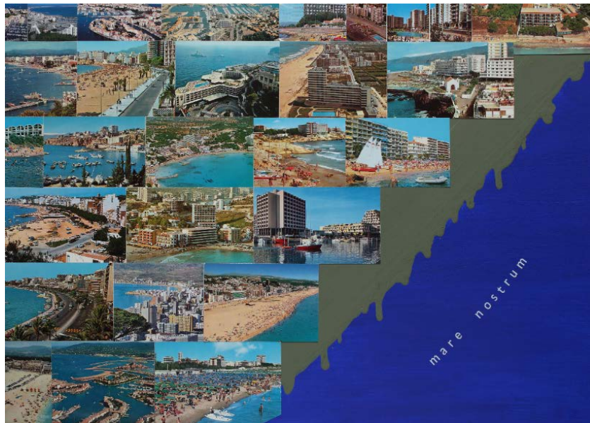
Mare Nostrum (Serie Meta Postal), 2018 © Joan Rabascall, ADAGP, París - VEGAP, Madrid, 2020

© Joan Rabascall, ADAGP, París - VEGAP, Madrid, 2020