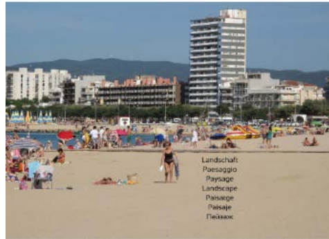
Vista parcial de la playa de Palamós (Serie Costa Brava 30 años) 1982/2012

© Joan Rabascall, ADAGP, París - VEGAP, Madrid, 2020