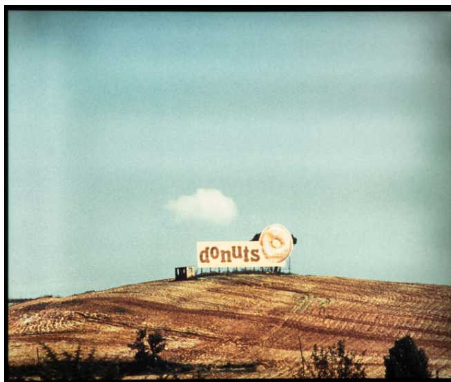
Serie Paisajes final del siglo xx 1993 © Joan Rabascall, ADAGP, París - VEGAP, Madrid,