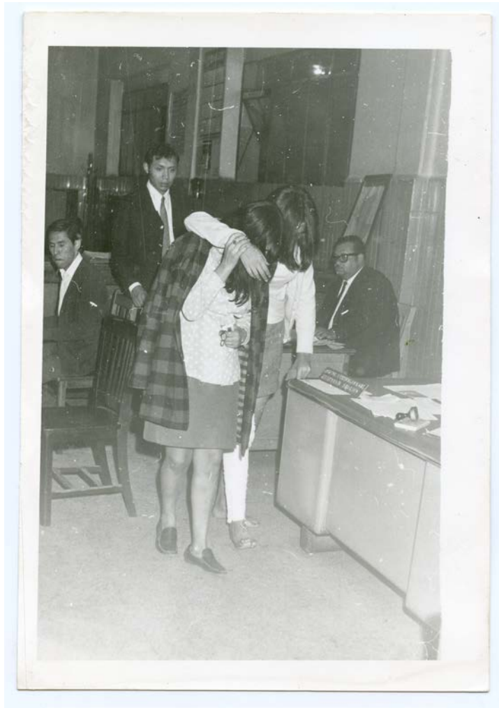
Cucurrucú , 2014 © Cristina De Middel