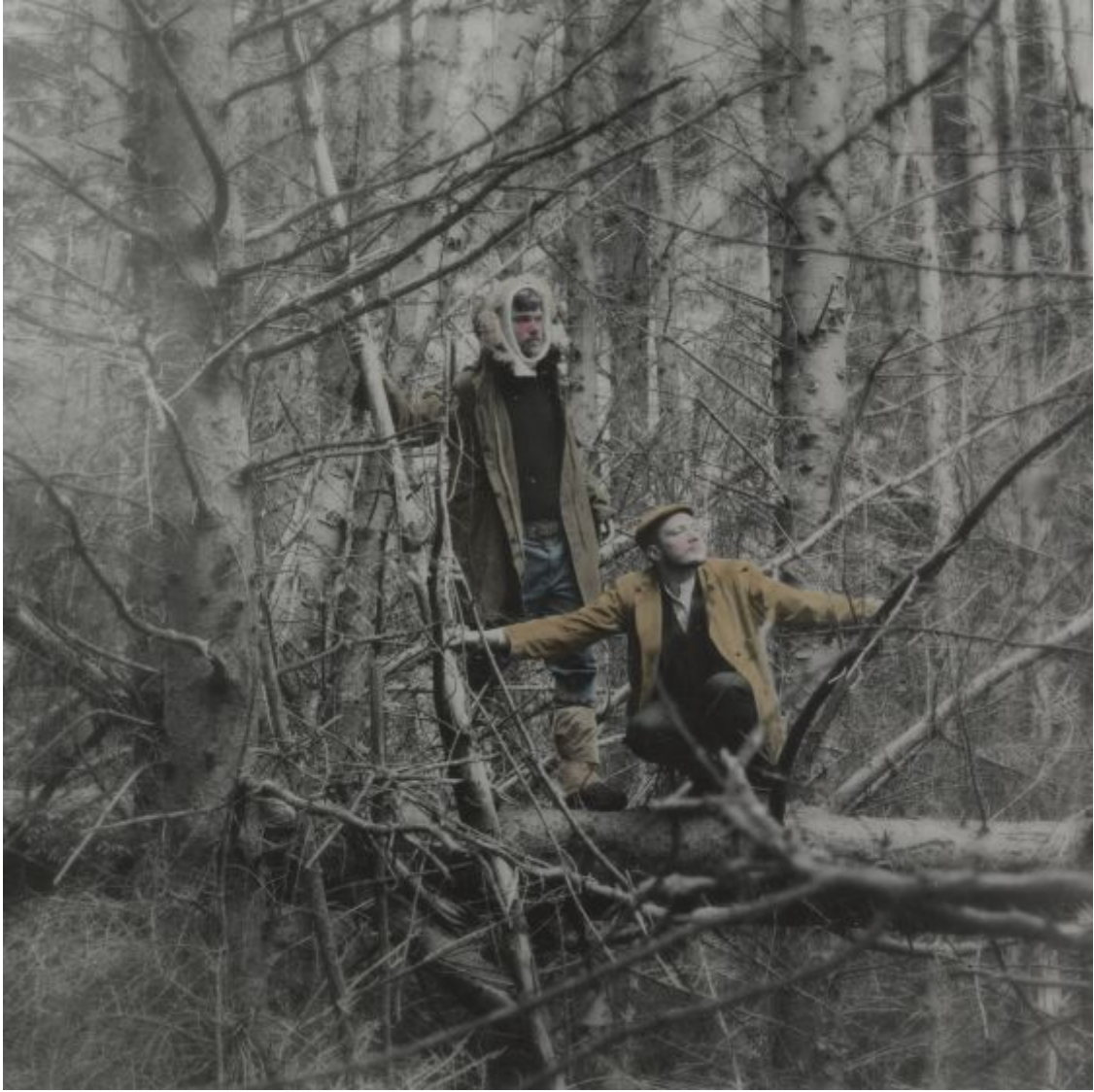
Jan Mayen , 2014 © Cristina De Middel