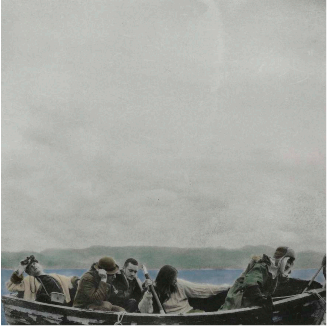
Jan Mayen, 2014