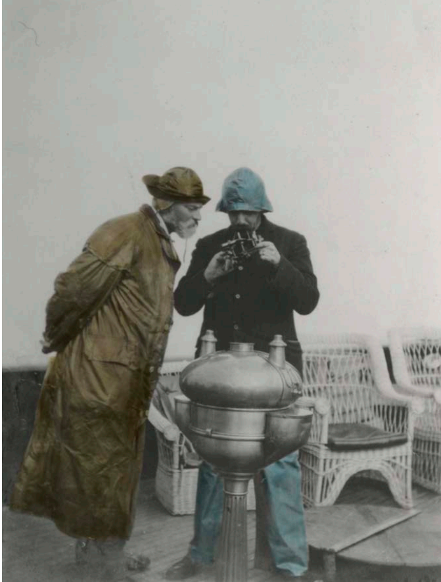
Jan Mayen, 2014