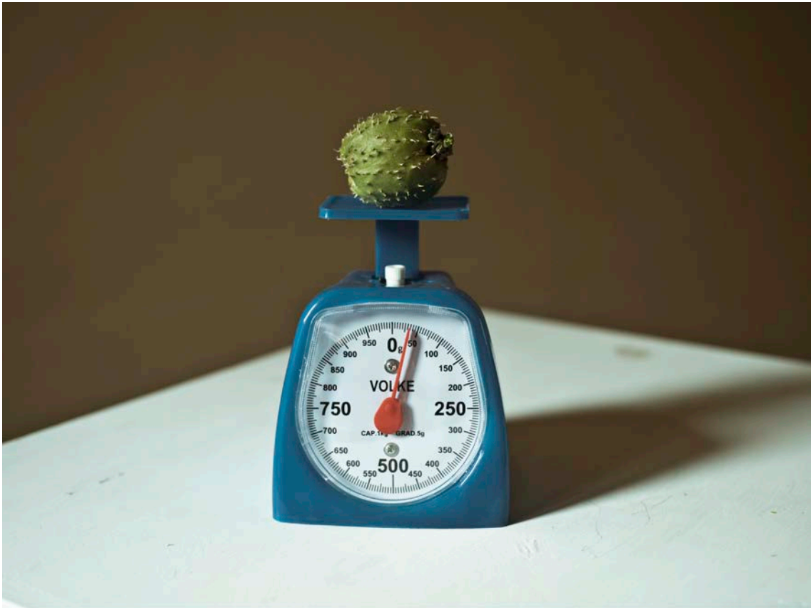
Aleatoris vulgaris , 2017 © Cristina De Middel