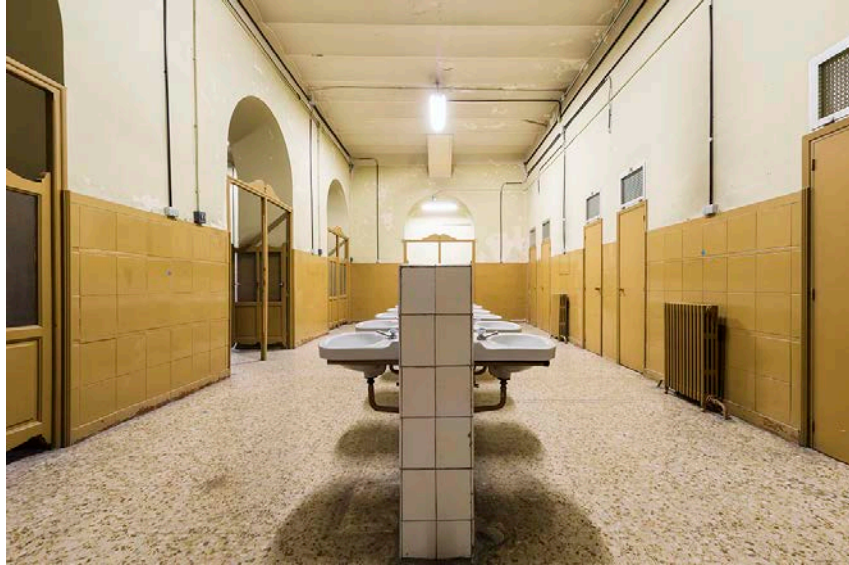
Uno de los espacios de Tabacalera Cantera.