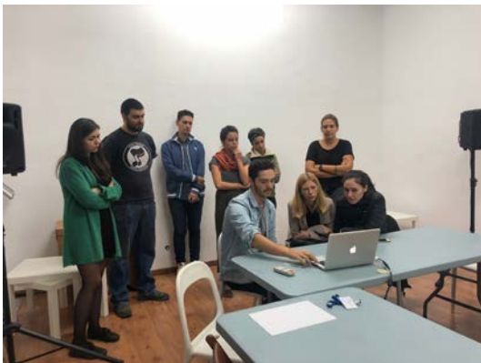
Tabacalera Cantera 2019. Visita Twin Gallery.

Los agentes invitados visitarán los estudios y aportarán su visión sobre los distintos proyectos en proceso. Igualmente se planificarán charlas, presentaciones y clases magistrales por parte de estos profesionales, que aportarán a los artistas del programa, de primera mano, material e informaciones avanzadas sobre el mundo del arte actual.