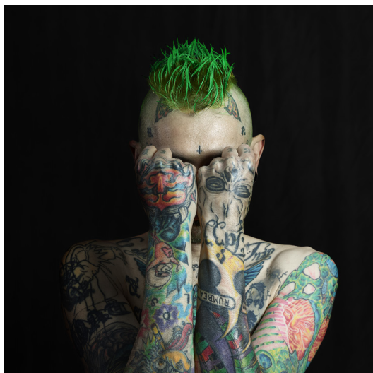
Serie Metamorfosis / 2016