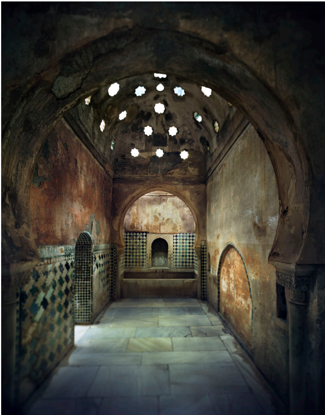
Pila en la sala caliente del baño de Comares

Obra fotográfica, placa negativo o color, positivadas en papel arte Hahnemüle montadas sobre dibón de aluminio en color.