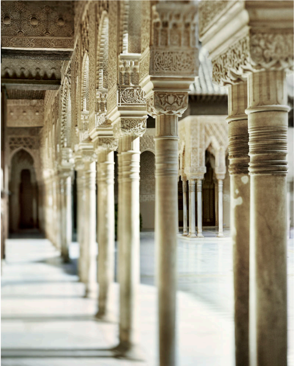
Galería norte del patio de los Leones