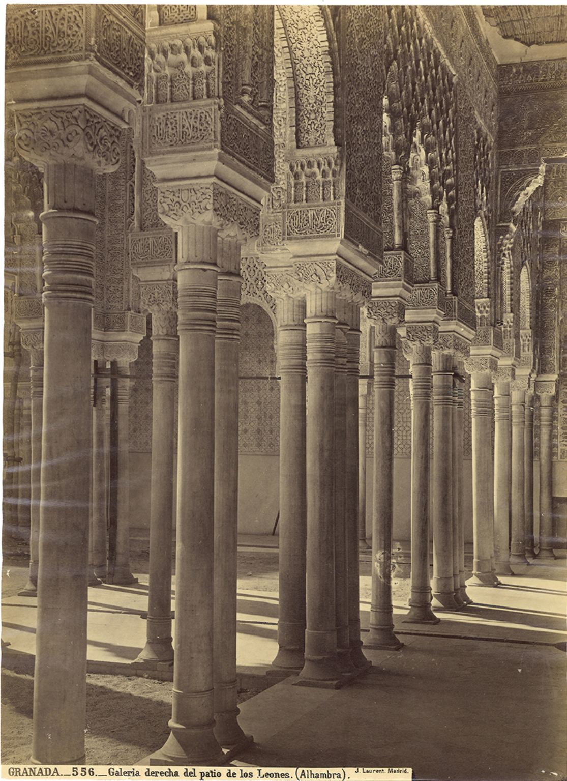
GRANADA... 556... Galería derecha del patio de los Leones. (Alhambra).