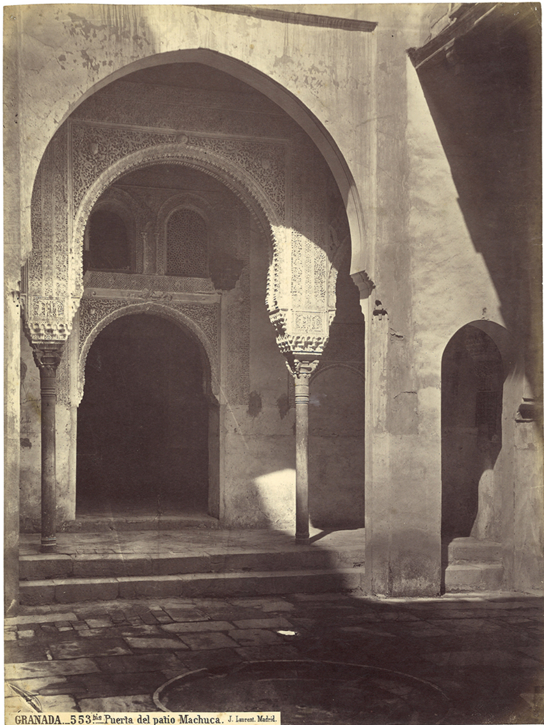
Puerta del patio Machuca

Obra fotográfica, placas de cristal, técnicas antiguas de positivado blanco y negro