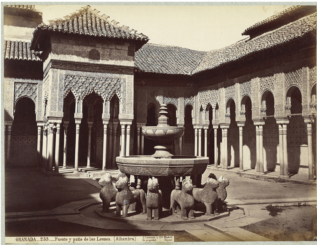
Fuente y patio de los Leones