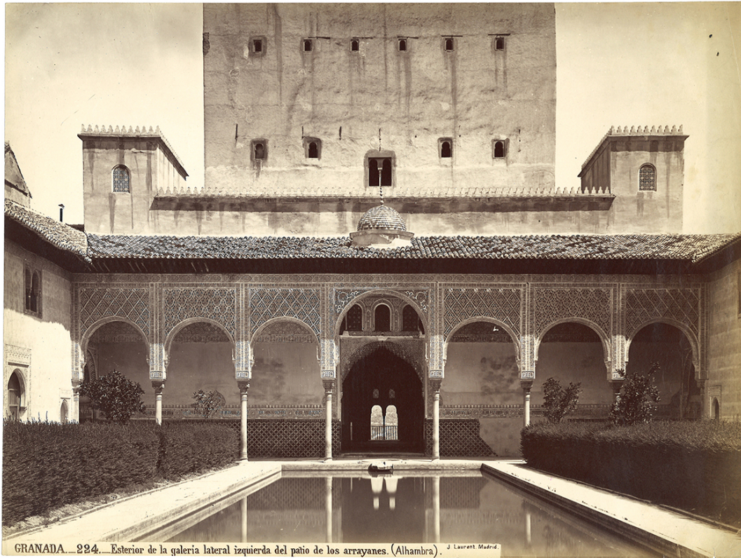
Exterior de la galería lateral izquierda del patio de los Arrayanes