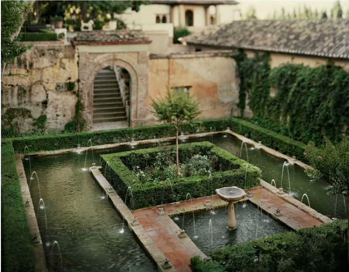
Patio del Ciprés de la Sultana en el Generalife