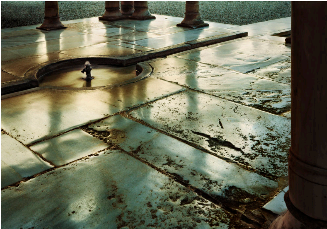
Reflejos en el mármol