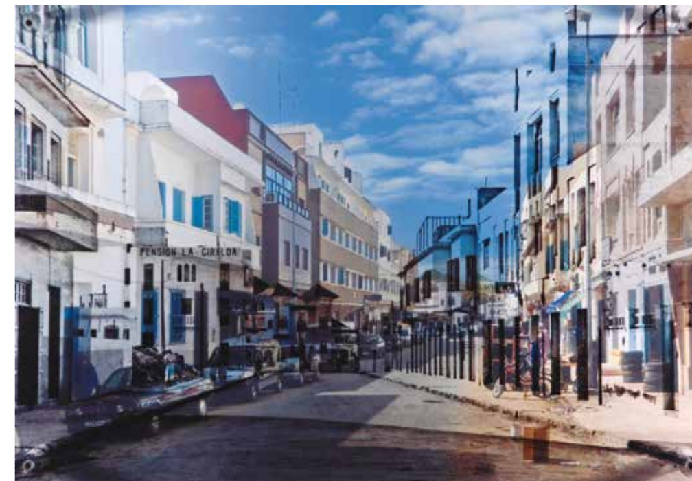
Calle 17 de Julio